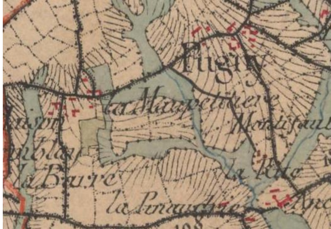
Pugny et La Maupetitière Carte d'état major du XIXème